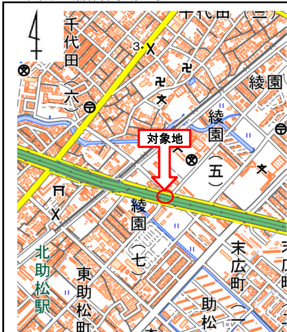
(1)位置図 (物件番号:第2号)