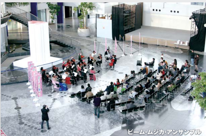
ビーム・ムジカ・アンサンブル