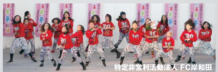
特定非営利活動法人 FC岸和田