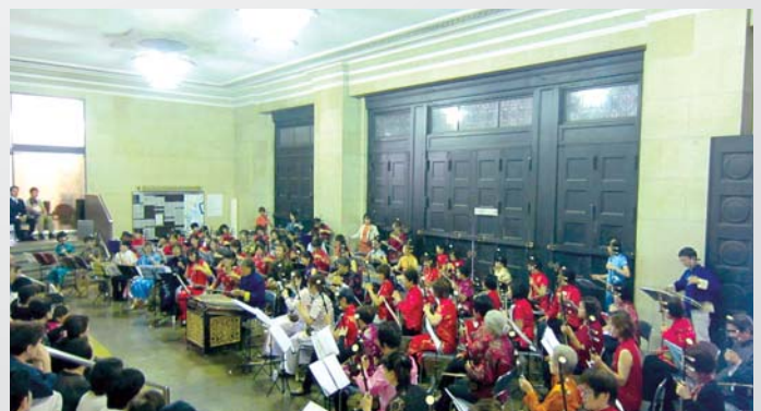
関西二胡演奏楽団「紅梅」