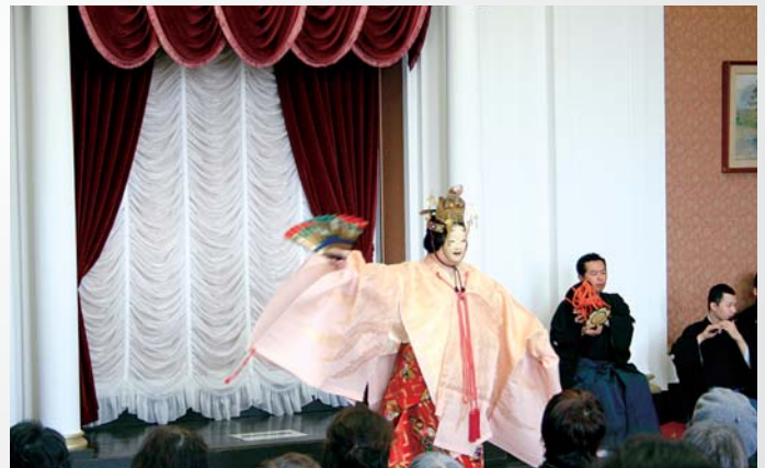
公益財団法人山本能楽堂