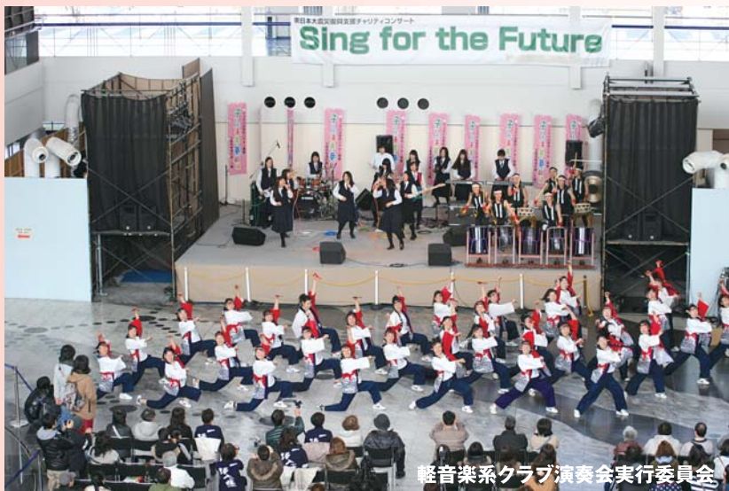
軽音楽系クラブ演奏会実行委員会