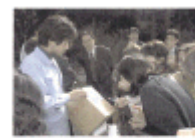
組合員による産地交流風景