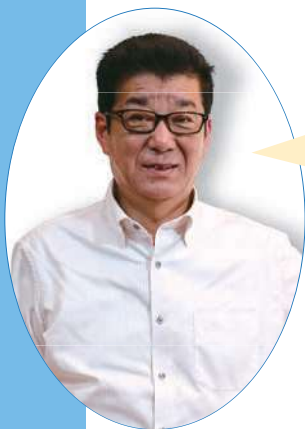
大阪市長 松井一郎

これまで、同じ方向を向いた知事と市長が連携を強め、大阪の成長への流れが生まれています。「副首都・大阪」の地位を確立し、成長の流れを確かなものとするためには、それを制度面から支える 新たな大都市制度が必要 です。