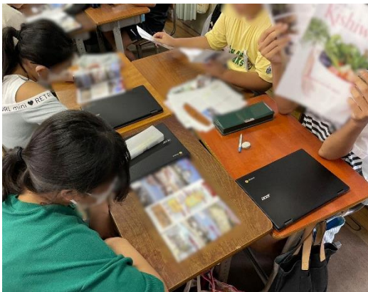
本物の岸和田市観光パンフレットを見比べています。