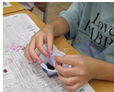
アサガオで色水遊び