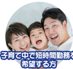
子育て中で短時間勤務を 希望する方