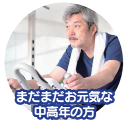
まだまだお元気な 中高年の方