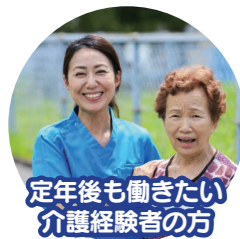
定年後も働きたい 介護経験者の方