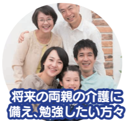
将来の両親の介護に 備え、勉強したい方々