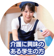
介護に興味の ある学生の方