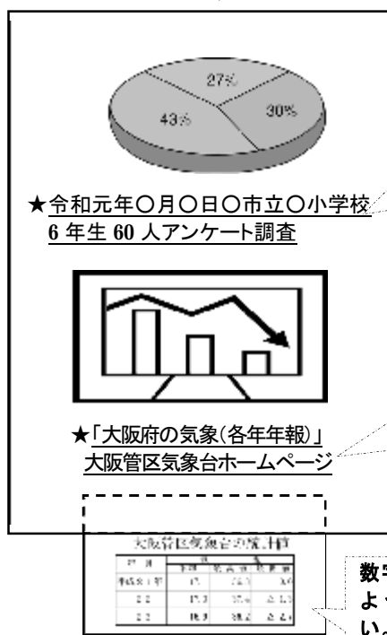
(3)アの記入例 作品表面