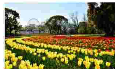
万博記念公園 吹田市千里万博公園 TEL 06-6877-7387 【最寄駅】大阪モノレール「万博記念公園駅」【公園東口駅】

万博記念公園(吹田市)で開催され、「人類の進歩と調和」をテーマに掲げ、77か国が参加。高度経済成長を成し遂げ、世界第2位の経済大国となった日本の象徴的なイベントとなった。テレビ電話や電気自動車が登場するなど、会場は未来感にあふれた。