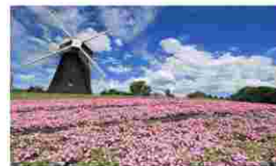
花博記念公園鶴見緑地 大阪市鶴見区緑地公園2-163 TEL 06-6911-8787 【最寄駅】大阪メトロ「鶴見緑地駅」

「花と緑と人間生活のかかわりをとらえ21世紀へ向けて潤いのある豊かな社会の創造をめざす」をテーマに花博記念公園(大阪市鶴見区)で開催。日本最大級の全面ガラス張りの大温室を持つ「咲くやこの花館」は現在も多くの人が訪れている。