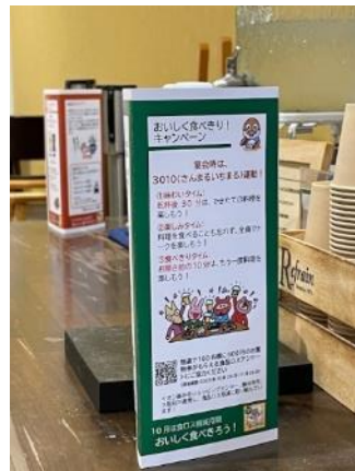
▲食べきりを促す三角柱による呼びかけ