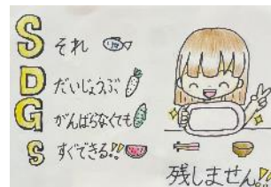
▲展示はがき絵（一例）