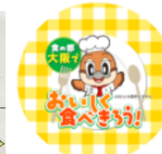
▲缶バッジのデザイン