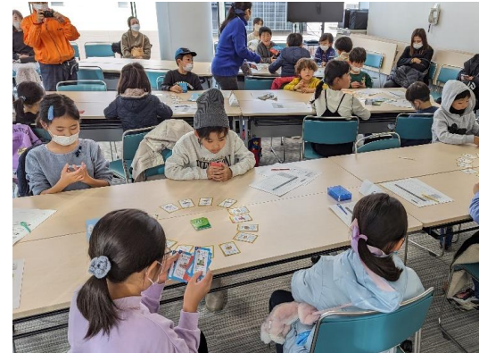
▲活動隊員によるカードゲーム体験