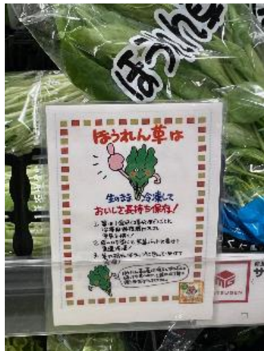
▲コトPOP配架の様子(一部)

・実施協力7店舗で完食できた小学生以下のお子さまに、特典（キッズおかいものけん100円分）をプレゼントし、食べ残しをなくすキャンペーンを実施。