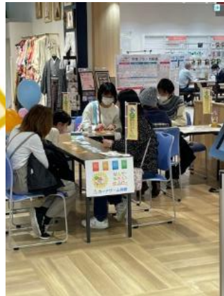
▲「なんでやろう？食品ロスカードゲーム」の様子