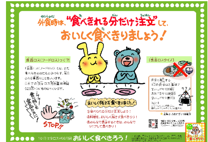
▲食べきりを促すトレイシートによる呼びかけ