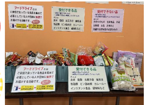
▲フードドライブの様子