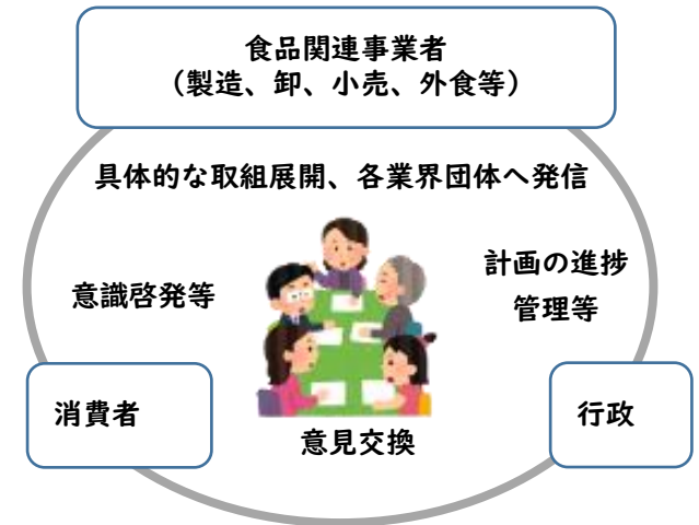
ネットワーク懇話会のイメージ

→これらを踏まえ、府として、事業者との取組等を通じ、原材料となる未利用食品・販売事業者等のマッチング、アップサイクルフードの魅力発信などについて協力していきます。