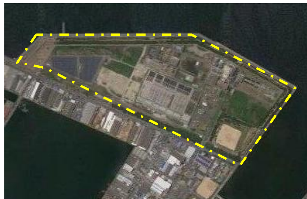
北部水みらいセンター(処理場)