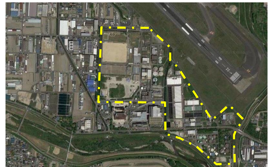
原田水みらいセンター (処理場)