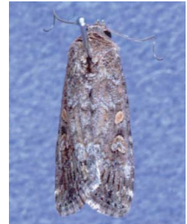
図 4 シロイチモジヨトウ成虫