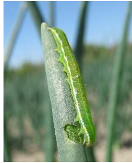
図 3 ネギの葉を加害する