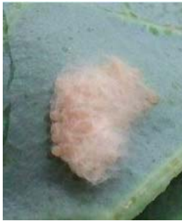
図 2 シロイチモジヨトウ卵塊