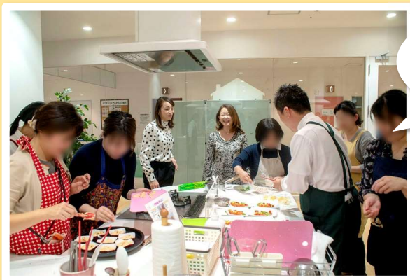
雑穀入り！ 栄養満点コブサラダ