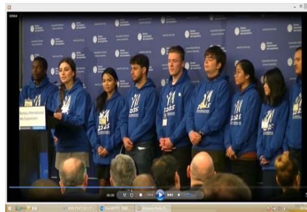
(ヤングアンバサダー)