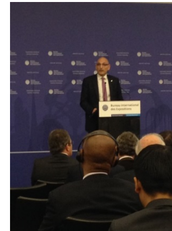
(2025年国際博覧会タスクフォース長)