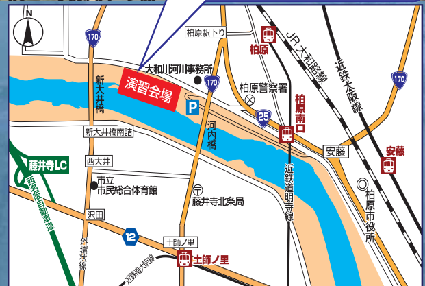
JR柏原駅から徒歩10分、近鉄道明寺線柏原南口駅から徒歩15分