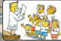
大和川博士も水防演習に参加!!