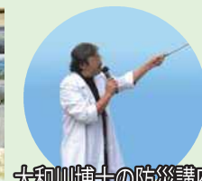
大和川博士の防災講座