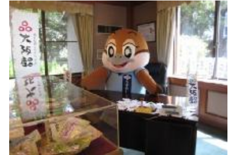
茶室 離れ風の静かな佇まいです