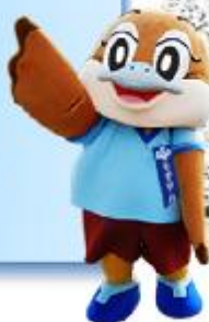
大阪府広報担当副知事 もずやん