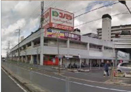
コノミヤ 空き店舗