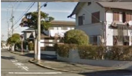
戸建住宅 空家空地