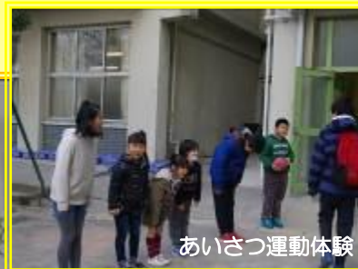
あいさつ運動体験