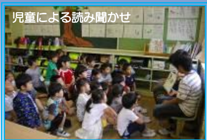
児童による読み聞かせ