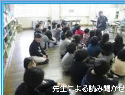
先生による読み聞かせ