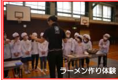
ラーメン作り体験