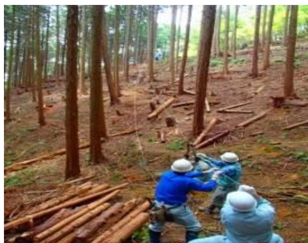
←ポータブルウインチによる未利用材搬出の作業イメージ