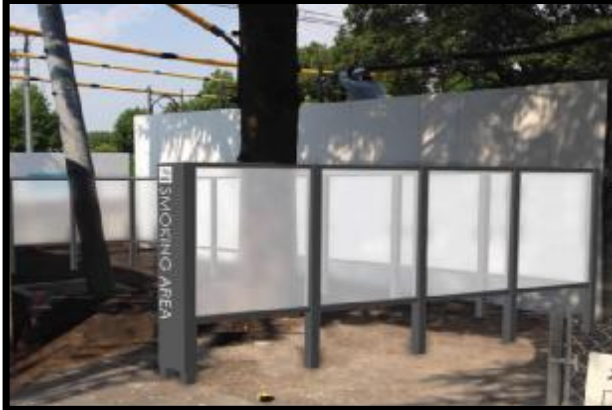
契約局東側隣接地