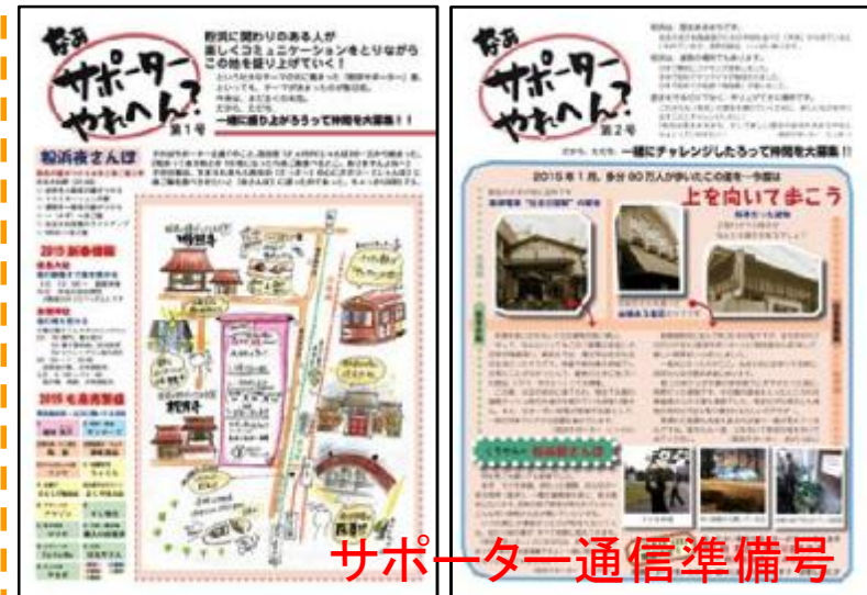
サポーター通信準備号