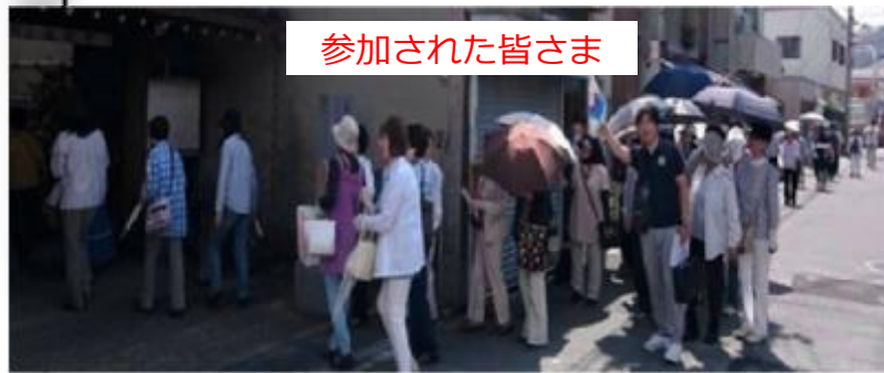
参加された皆さま