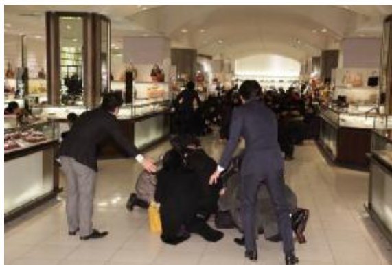
百貨店店内での顧客の保護訓練の様子（池袋会場）

安全確認の後、顧客を安全な場所に移動させ、館内放送による「むやみに移動を開始しない」などの呼びかけを行いました。