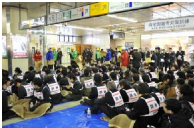
駅構内における乗客の保護（新宿会場）