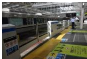
写真：可動式ホーム柵

* 駅利用者の安全を確保するために、可能な限り府内全駅に設置されるよう鉄道事業者に対して働きかけていく