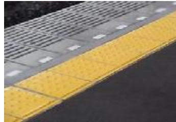
写真：内方線付き点状ブロック