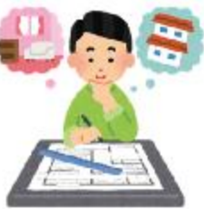
建築士・ 構造建築士