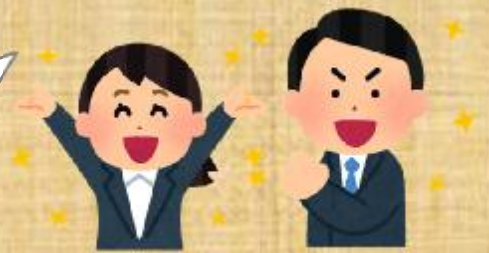
大阪府耐震コーディネーター