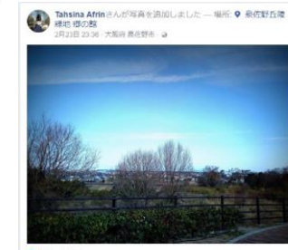
③パークセンター付近からの景色を撮影