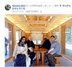
①水辺の休憩所で参加者との記念撮影

また、ツアー開催後(2/23 23:35)に参加者があげたSNSの内容の一部は下記の通りである。参加者との写真や公園内で気に行った場所や景色などの写真が多くあげられている。