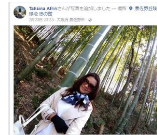
②竹林を背景にした撮影