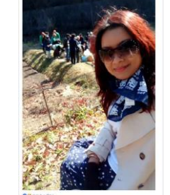
④じゃがいもの植え付けの様子を撮影