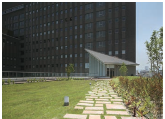
隣接する附属病院の病室からも眺められる屋上庭園