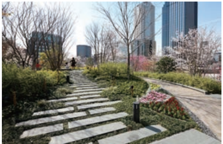
河岸沿いの緑と連続する花木を中心とした華やかな植栽