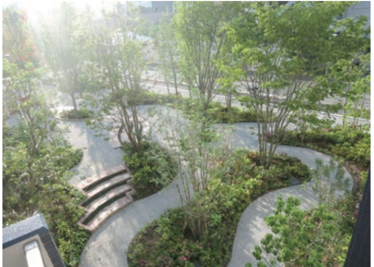
高木を中心とした緑量豊かな広場