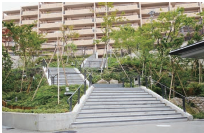
千里山の丘陵地形を活かしたもみじ坂