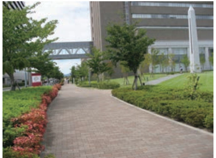
淀川河川公園につながる緑豊かなプロムナード