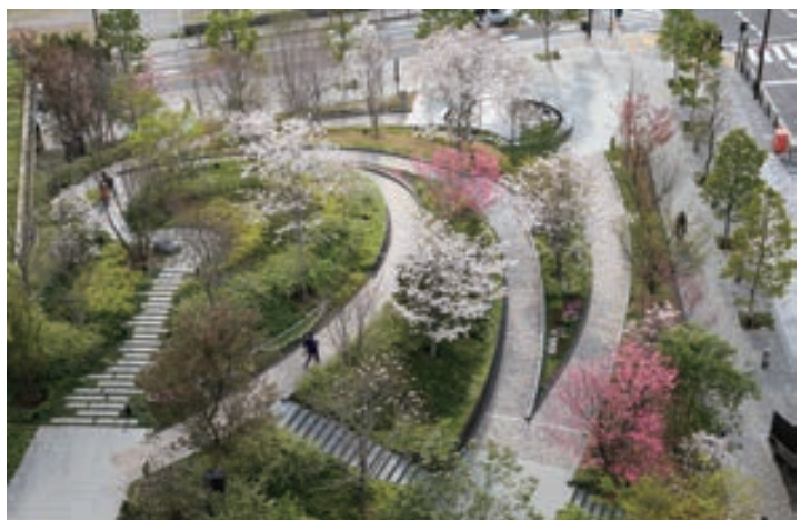
ゆるやかなスロープ沿いに四季折々の自然を感じられる丘形状緑地