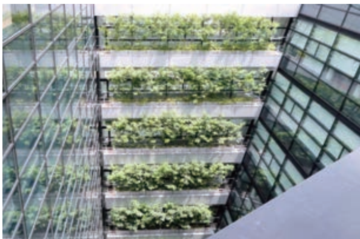
吹抜け内のシマトネリコによる壁面緑化