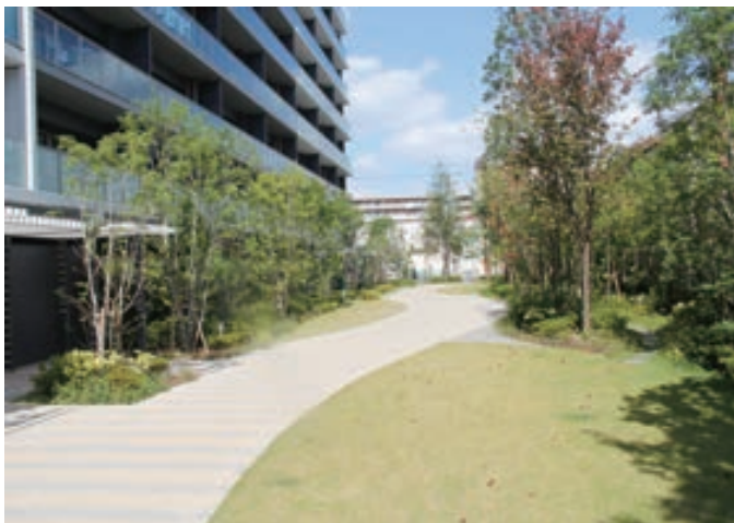
花木をアクセントとした幅広い遊歩道