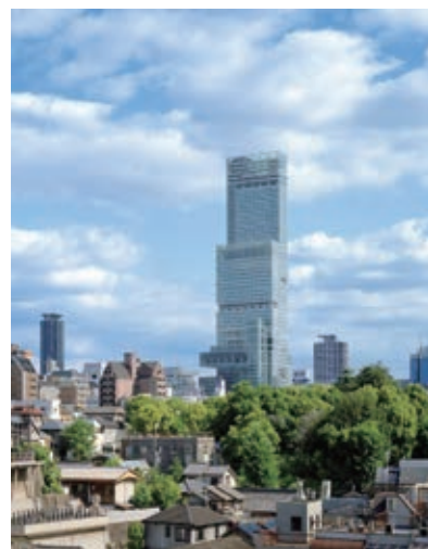
上町台地の緑との連続性に配慮