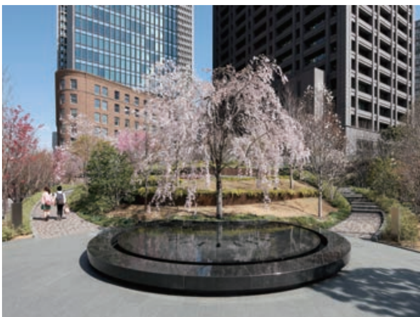
中之島四季の丘正面のシダレザクラ