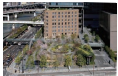
中之島四季の丘の全景