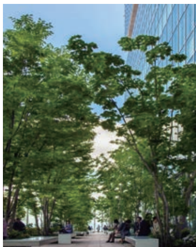
在来種にこだわった16階緑地