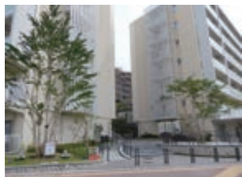
シンボル樹を配したエントランス