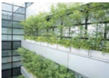
各階テラスのプランターに植栽