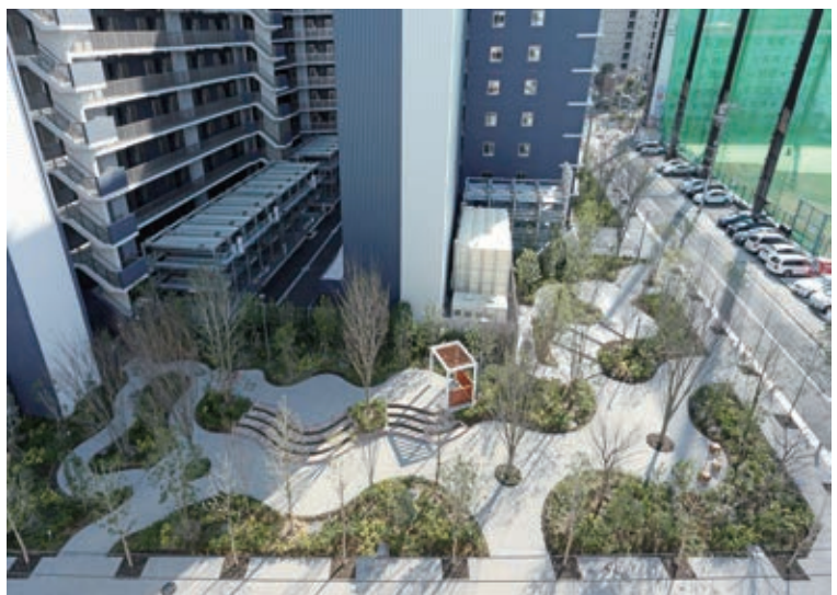
地域住民に緑あふれる空間を提供