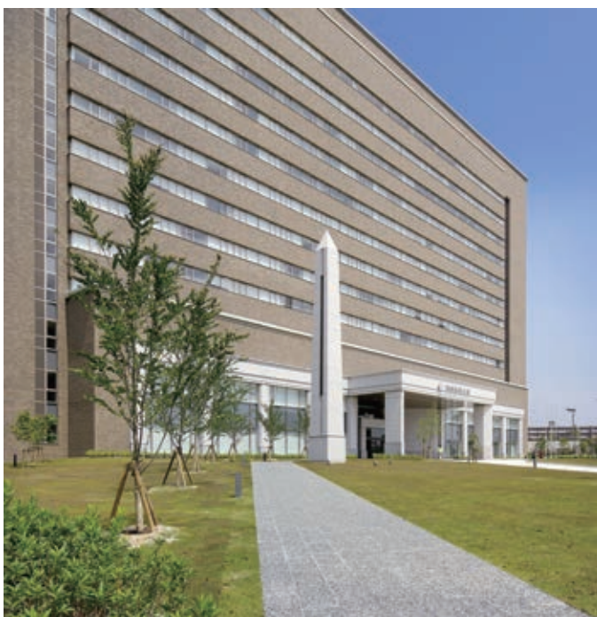
手入れの行き届いた学舎正面の芝生広場