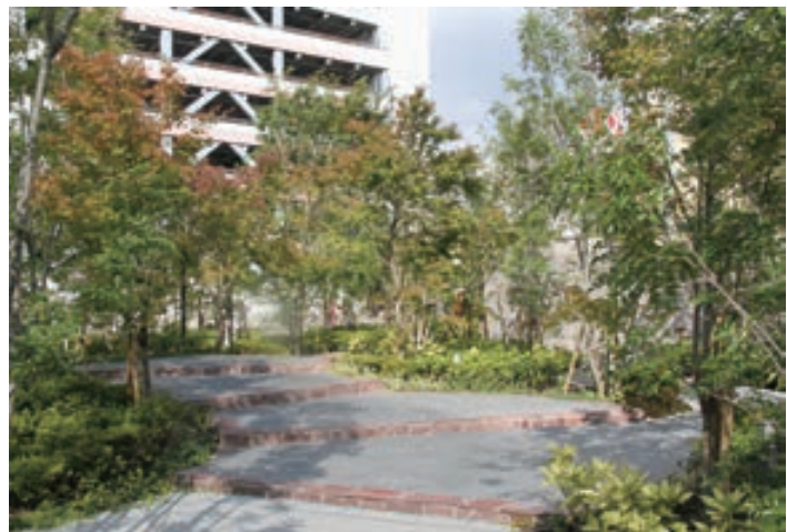
様々な樹種による季節を感じられる植栽