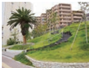
サクラが幹に着生したフェニックスの移植木