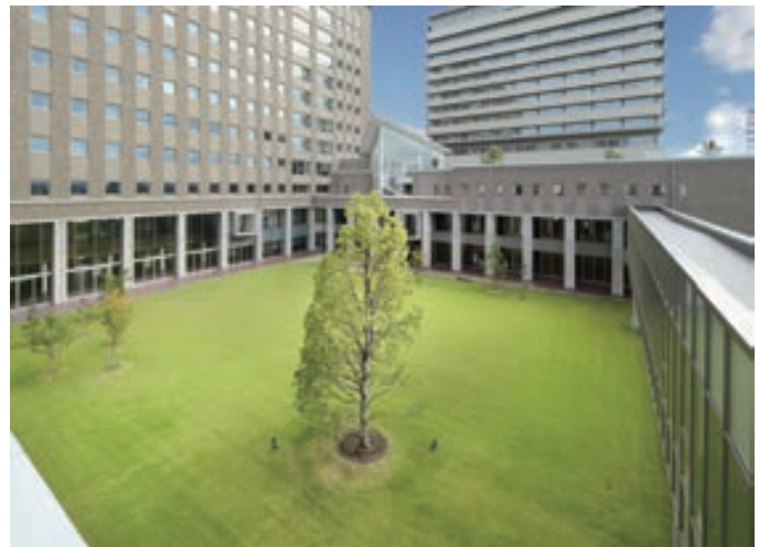
中庭の芝生広場とシンボルツリーのクスノキ