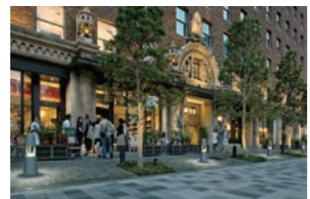
にぎわい空間と一体となったクスノキ並木