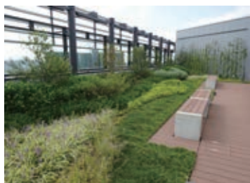
薬草を中心とした屋上庭園