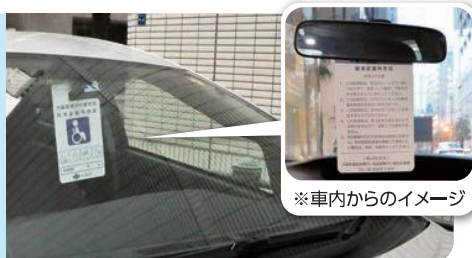
※車内からのイメージ

利用証は駐車する時、ルームミラーにかけるなど、外から見えるように掲示してください。