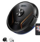
Eufy RoboVac X8 Hybrid カラー：ブラック、ホワイト