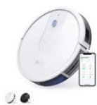
Eufy RoboVac 15C カラー：ホワイト、ブラック

https://www.ankerjapan.com/pages/robovac-support