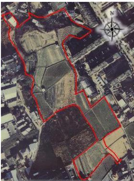
▼航空写真（施行前：平成6年頃）