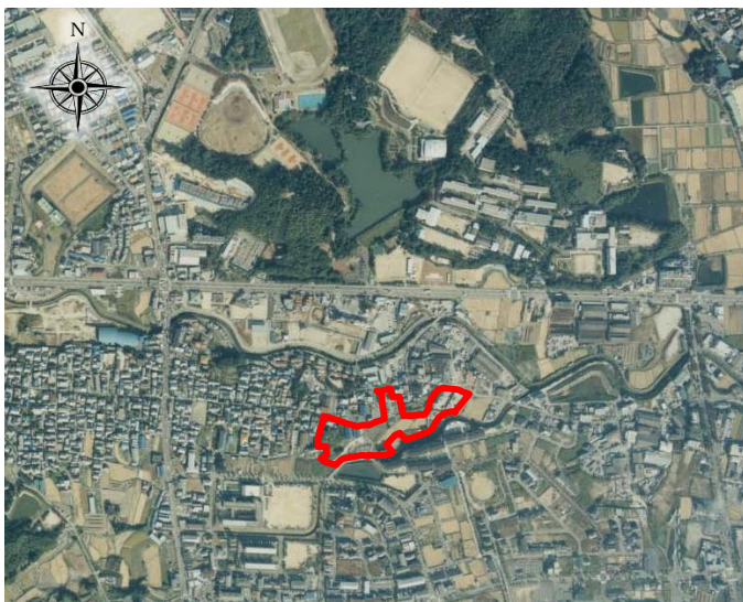
▼航空写真（施行前：平成5年頃）