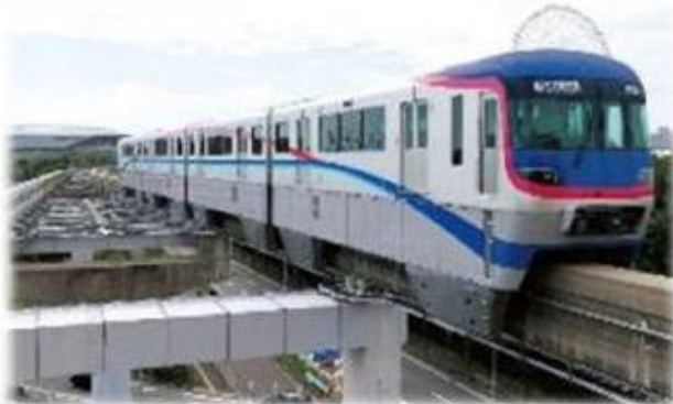
モノレール営業線