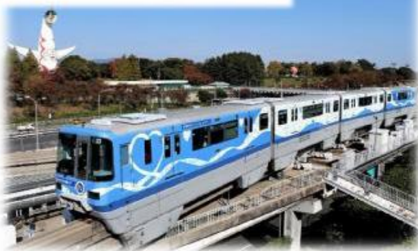
ブルーエール号（日本鉄道賞特別賞）