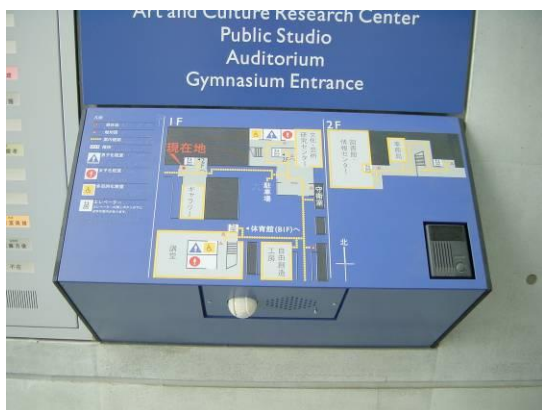
○図 13.2 触知図案内板の例

点字等による案内板（目の見える人も使えるように大きめの墨字を併記するとともに、音声による案内、インターホンも設置）