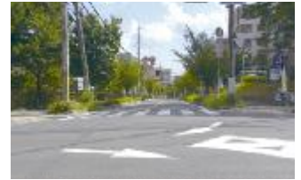
① 緑視率: 25.9% (一般的に緑が豊かだと感じられる風景例)