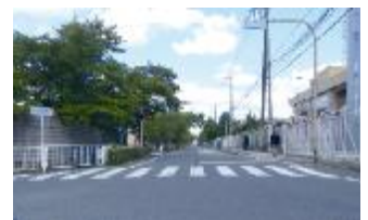
③ 緑視率: 17.5% (池田市の平均緑視率の風景例)