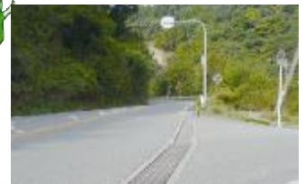
② 緑視率: 45.1% (緑視率の高い風景例)