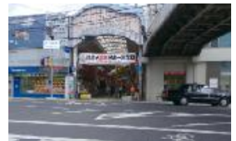
④ 緑視率: 0.1% (緑視率の低い風景例)