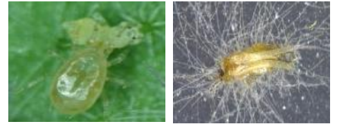
▲スワルスキーカブリダニ

→赤色を認識できないアザミウマ類には赤色ネットが真っ黒な壁に見えると言われており、外部からの侵入防止効果が見込まれる。