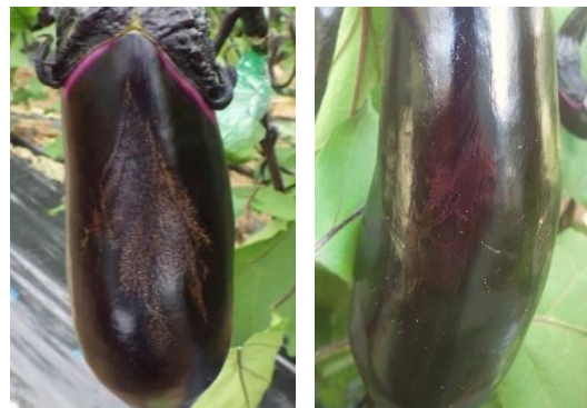
▲焼け果（ハの字型） ▲焼け果(不定形型)

今回、試験を実施した小型パイプハウス（1.5a）では、対照区と比べ不定形型の焼け果に差は見られなかったものの、ハの字型の焼け果が最大で約20～30%減少しました。