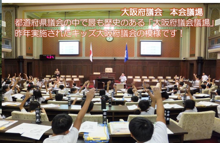
大阪府議会 本会議場 都道府県議会の中で最も歴史のある「大阪府議会議場」 昨年実施されたキッズ大阪府議会の模様です！

大阪府では、庁舎見学と府の取組みについて学ぶテーマ学習をセットした『府政学習会』と、実際の府議会議場で議会を模擬体験していただく『キッズ大阪府議会』がワンパッケージとなった小学校高学年向けのプログラムを提供しています。