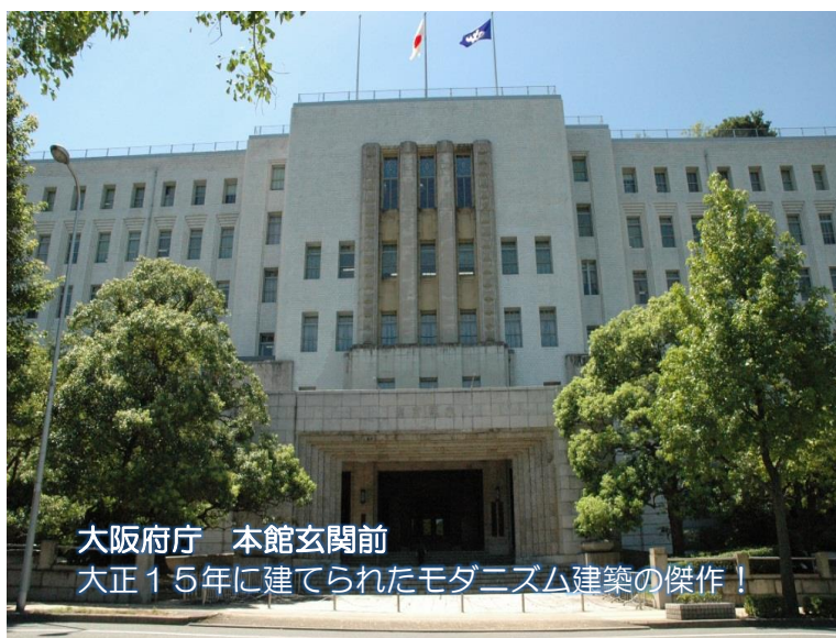
大阪府庁 本館玄関前 大正15年に建てられたモダニズム建築の傑作！

大阪府では、庁舎見学と府の取組みについて学ぶテーマ学習をセットした『府政学習会』と、実際の府議会議場で議会を模擬体験していただく『キッズ大阪府議会』がワンパッケージとなった小学校高学年向けのプログラムを提供しています。