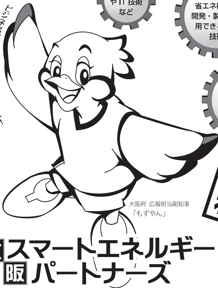
大阪府 広報担当副知事 「もずやん」