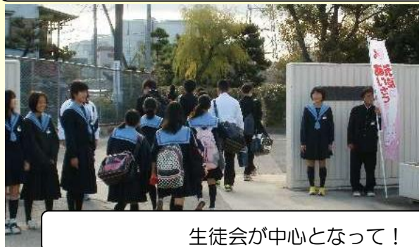
生徒会が中心となって！ 保護者の方も協力！

生徒会、PTA、小学校で協力し合ってあいさつ運動を実施！！ 【各学期ごとに期間を決めて実施しています】