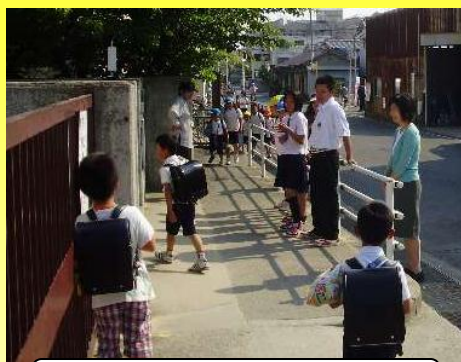
中学生が小学校へ！