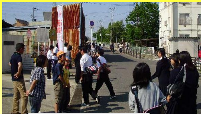
小学生が中学校へ！

生徒会、PTA、小学校で協力し合ってあいさつ運動を実施！！ 【各学期ごとに期間を決めて実施しています】