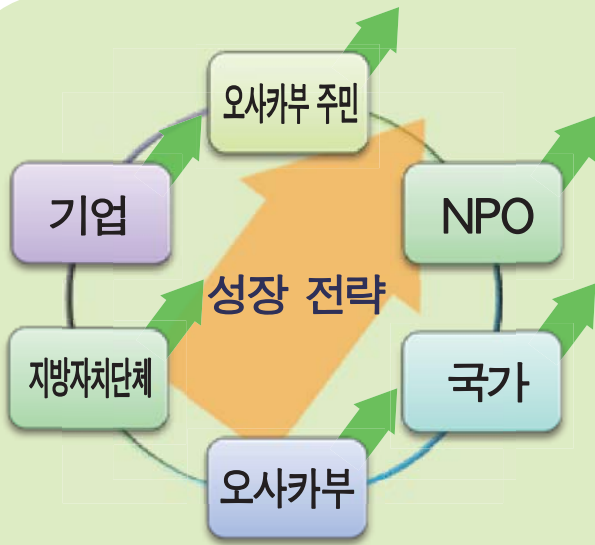
다양한 주체가 방향성을 공유