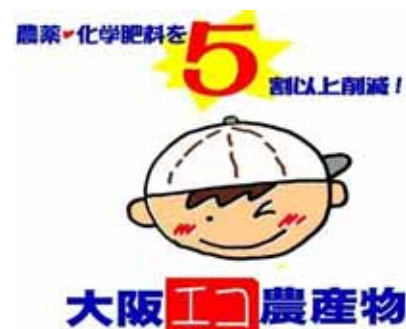
図-32 大阪エコ農産物認証マーク