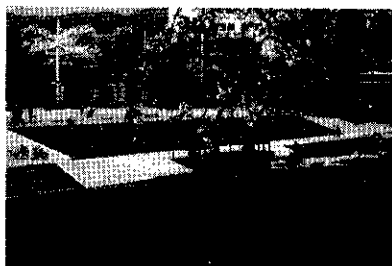
<芥川環境整備事業>

芥川、石川、安威川等において階段護岸や高水敷、遊歩道、桜つつみの整備等の河川環境整備事業を実施した。