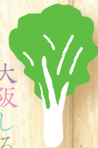
大阪しろな Osaka shirona