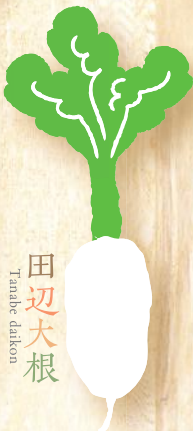
田辺大根 Tanabe daikon