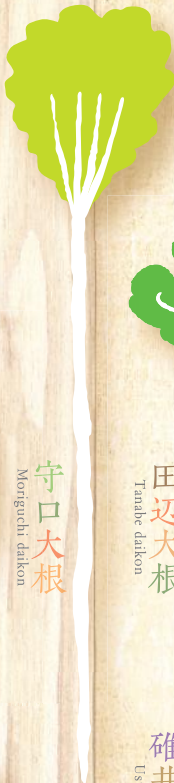
守口大根 Moriguchi daikon