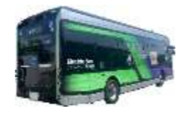
EVバス(路線バスタイプ)

万博会場へのクリーンな移動手段の確保のため、博覧会協会が示す来場者輸送方針等を踏まえ、駅シャトルバス等へのEV/FCバス導入(約100台)について大阪府市が必要な経費の一部を補助する(R4～6年度の3か年事業)。