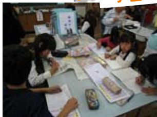
(支援まなび舎Kids)放課後学習の支援 (吹田市)