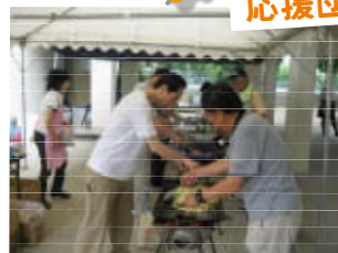
お父ちゃんの家(豊中市)