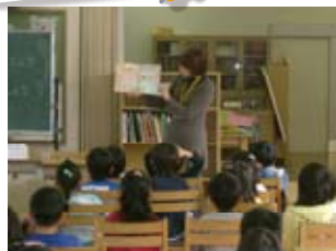
地域ボランティアによる読み聞かせ (松原市)