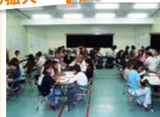
子育て語ろう会(八尾市)