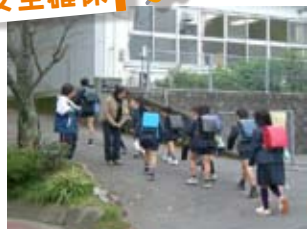
あいさつ運動(泉南市)