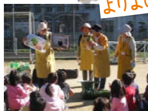
子どもと一緒に花壇整備 (河内長野市)