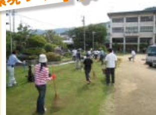
校庭の芝生の管理(池田市)