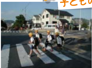
安全見守り活動(太子町)