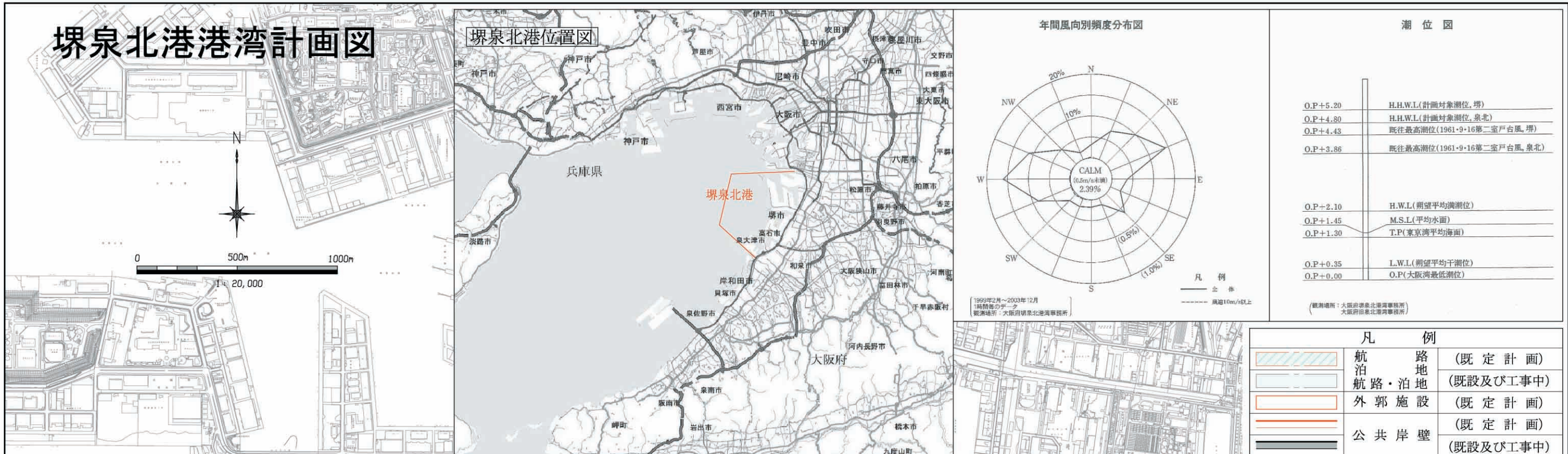
年間風向別頻度分布図