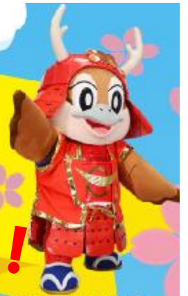
大阪府広報担当副知事 もずやん

国民の2人に1人が何らかのアレルギーをもっているという調査結果もあり、いまやアレルギーは「国民病」とも言われています。アレルギーは正しい知識をもって適切な対応をすることで、上手にコントロールすることができます。