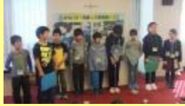
発表会・交流会。みんなの熱い想いが伝わってきました！！