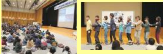
発表会・交流会。みんなの熱い想いが伝わってきました！！

近畿各地から29の団体や小学校・中学校等の約170名が集合！学校や地域で取り組んでいる身近な水辺での活動や体験を熱い想いを込めて発表しました。 一般参加者や協力団体等を含めると、総勢約450名の方に参加いただき、会場は大盛況！子どもたちは、体験や展示物なども満喫しながらたくさんの方と交流し、楽しく有意義な1日となりました。