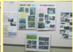
中河内地域交流会からも展示を行いました

文化、環境、防災の面から水辺のむかし、いま、これからについて話し合い、まとめた意見をテーマに川の絵をみんなで描きました。